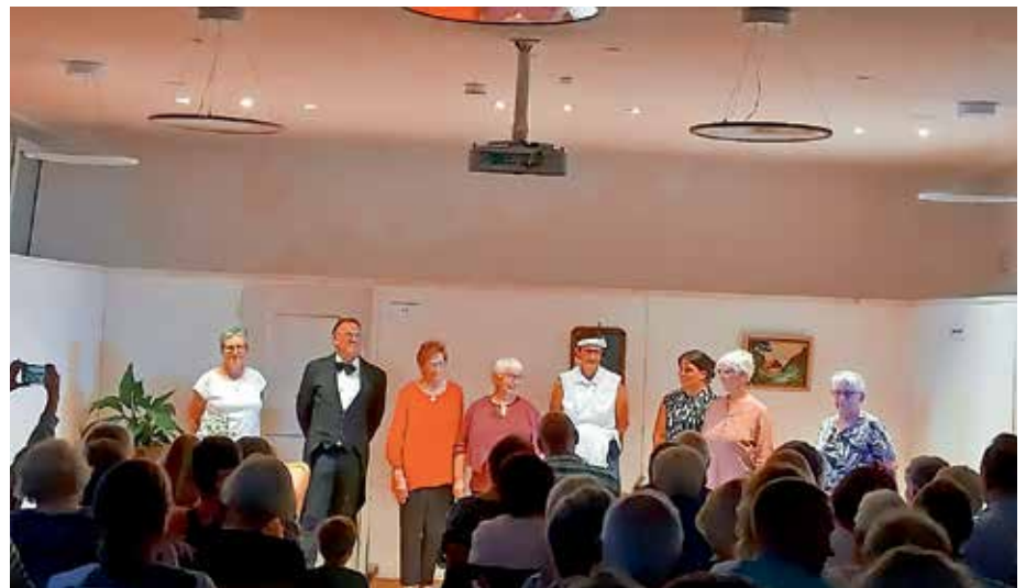
Die Darsteller mit Suffleuse